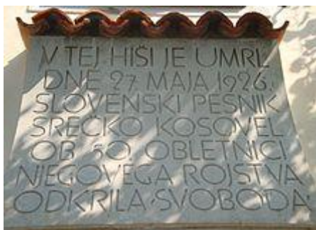
Spominska plošča na hiši v Tomaju

Konec februarja 1926 se je po nastopu v Zagorju , ko je ponoči na postaji čakal vlak, prehladil in zbolel, a se, vsaj tako je bilo videti, pozdravil. Za velikonočne počitnice se je lahko vrnil v Tomaj. Tu se je bolezen ponovila in pojavili so se zapleti. Umrl je 27. maja 1926.